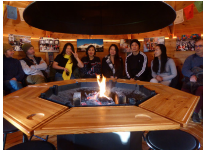
Dans l'attente de la galette: le kota en janvier 2020 .