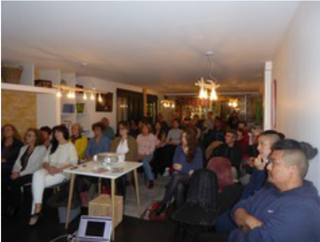
Pendant la projection de Zanskar, petit Tibet.