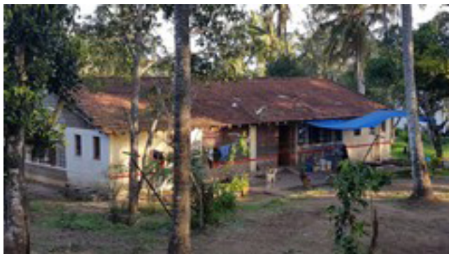
Maison d'enfants au TCV de Bylakuppe.

salle de bains et toilettes, salle de séjour - m'ont paru très propres et bien adaptés aux besoins des enfants.