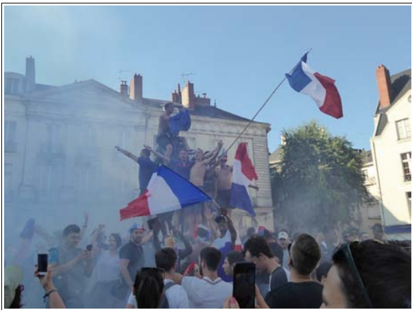
...avant de fuir la foule en délire ! (ici place du Bouffay)